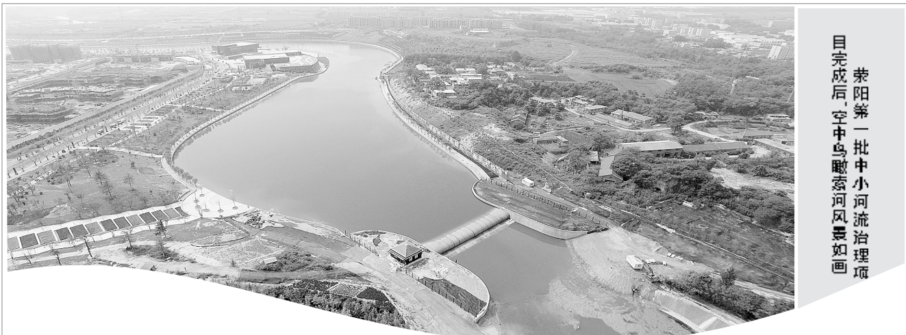
目完成,后空中鸟瞰索河风景如画

该市卫计委还从提升基层服务能力入手,建立了基层首诊、双向转诊、急慢分治、上下联动的分级诊疗模式,有效降低群众就医负担。