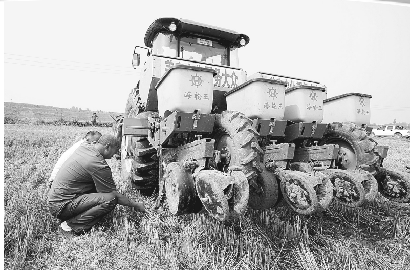
三夏期间收与种同等重要。新郑市日前用于播种玉米的机械发挥积极作用,助力农民快速播种玉米。据了解,此机械可深松25厘米,分6层施肥,而多层施肥可以确保作物根部在不同生长期都能吸收到养分。