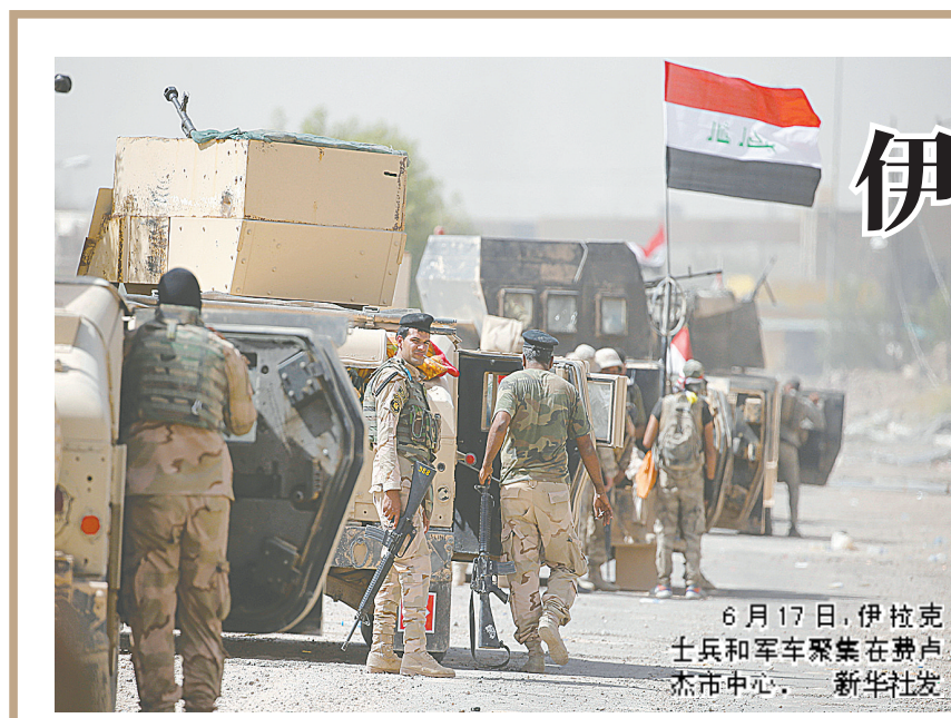
6月17日,伊拉克士兵和军车聚集在费卢杰市中心。

“向阳红”是我国在上世纪60至90年代建造的一系列科学考察船的舷号,“蛟龙”号载人潜水器母船“向阳红09”就是其中一员。这批“向阳红”科考船目前大部分已经退役或更改舷号,其中“向阳红01”也已退役。近年来我国新建的科考船又重新使用了“向阳红”系列舷号。