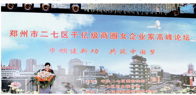
举办千亿级商圈女性企业家高峰论坛

同时，社区依托“136”党群连心服务室，定期举办“居民议事厅”，邀请居民代表共同参与商议社区建设事宜。社区还运用网络、微博等现代化通讯媒体，建立了“民主社区一家亲”QQ群、微信群，实现了与居民实时互动交流，及时了解民情民意，高效迅速为民解忧，大大提升了居民满意度指数。