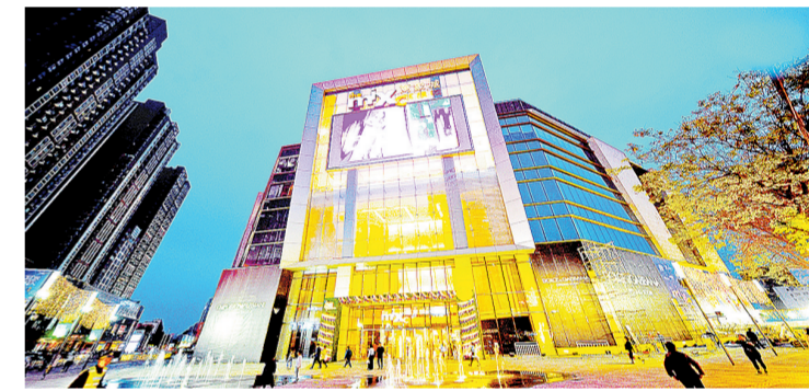
夜幕下的二七商圈流光溢彩