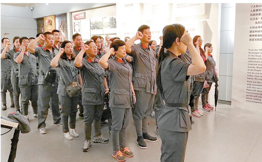
追忆先烈英雄事迹，街道党员重温入党誓词

“二七商圈”所在的二七区因京汉铁路工人大罢工而得名，二七区解放路街道以郑州解放而得名，华润集团又是八路军创办的红色央企……天然的红色基因因为二七商圈红色党建发展提供了优渥的土壤。长久以来，解放路街道以打造高端商贸核心示范区为目标，围绕“红色商圈”建设，通过狠抓“两学一做”学习教育，塑队伍、强基础、聚人心、汇合力，推动了辖区经济社会持续健康发展。