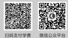
扫码支付学费 微信公众平台

气质不俗 | 品位不凡 | 口吐莲花 | 落落大方 名师指导 | 落地实操 | 惊喜蜕变 | 魅力自现