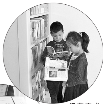
阅览室成村民求知乐园