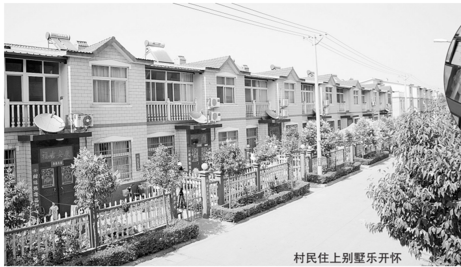
村民住上别墅乐开怀

展思路。大量人力、物力、财力的投入,一系列软、硬件设施的建设,使企业的管理规范有序,产品质量得到了有力保障。目前公司资本超亿元,员工700多名,占地15万平方米,产品从原来的单一品种发展到现在的13大系列,出口到美国、加拿大、俄罗斯、非洲等国家和地区。