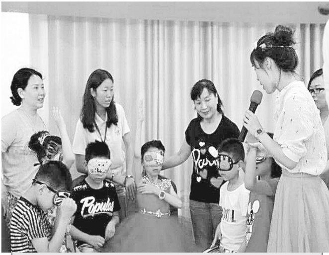
昨日早,管城区“红十字精神传播志愿服务队”的十几名社会志愿者驱车赶往荥阳市刘河镇,看望为“敦煌杯”香港音乐周参加赛前集训的“音乐之光”二胡社团盲人孩子们,为他们送上慰问品。