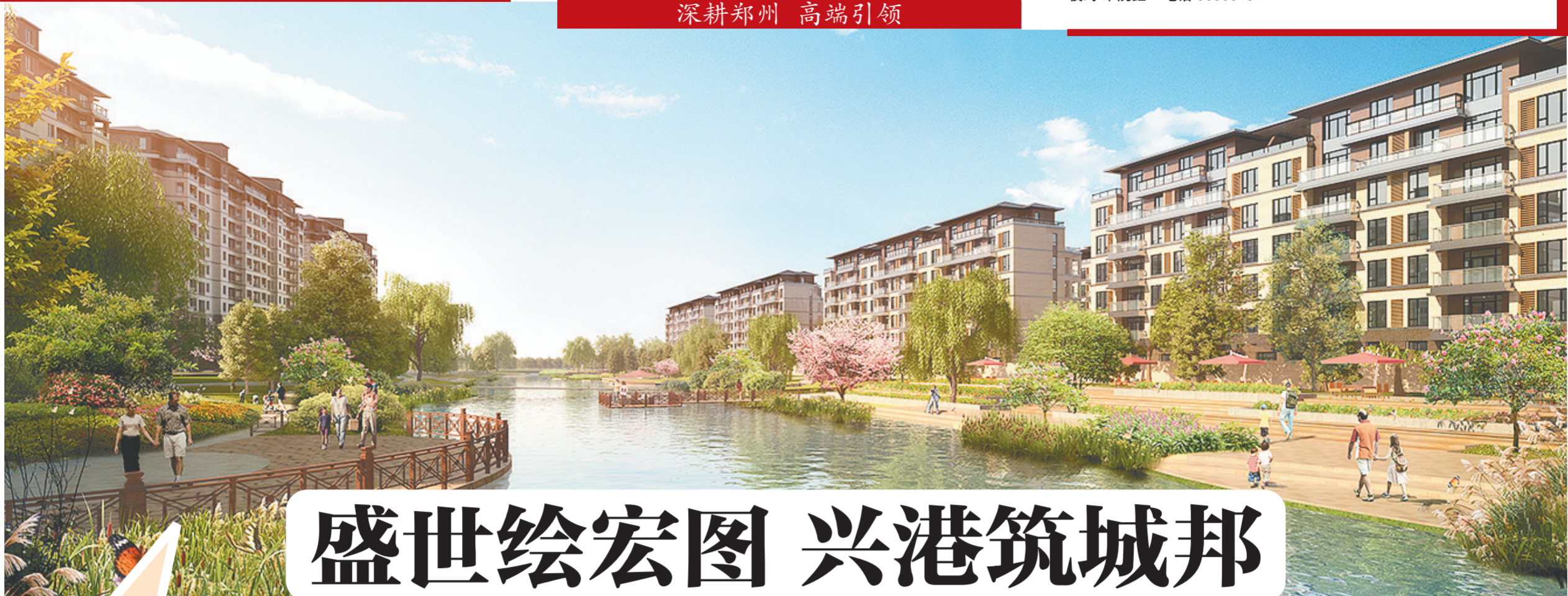
和昌盛世城邦住宅组团效果图