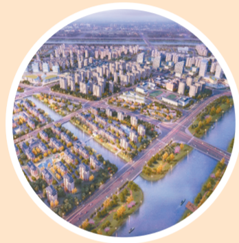
和昌盛世城邦总体规划鸟瞰效果图