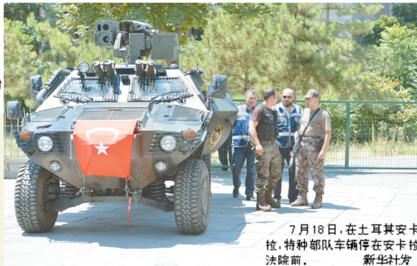
7月18日,在土耳其安卡拉,特种部队车辆停在安卡拉法院前。

土耳其总统雷杰普·塔伊普·埃尔多安7月18日接受美国媒体独家采访,讲述自己在未遂政变当晚的遭遇。他说,如果稍晚离开度假酒店,他可能就没命,而且乘机即被抵达伊斯坦布尔时,阿塔图尔克国际机场的地面控制塔仍在政变军人控制下。