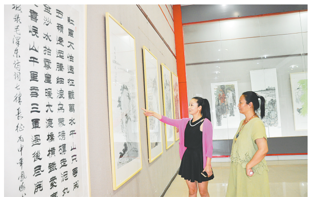
昨日,“八一建军节”书画邀请展在河南大观音阁开幕,100多幅书画精品抒发了对祖国大好河山和子弟兵的浓浓深情。

活动主办方心肺呼吸俱乐部负责人告诉记者,现在随着人们健康理念的增强,有越来越多的人加入到跑步这项运动中,但是很多人对于这项运动的认知还停留在表面,这也造成了一些跑步爱好者在跑步以后出现运动损伤,开办科学跑步大讲堂的目的,就是教会跑步爱好者们如何才能科学地跑步,以科学、合理、高效的方式获得健康与活力。今后,心肺呼吸俱乐部还将不定期举办这样的科学跑步大讲堂,引导广大跑步爱好者从简单的关注健康,进阶到健康跑步、科学跑步,享受跑步。