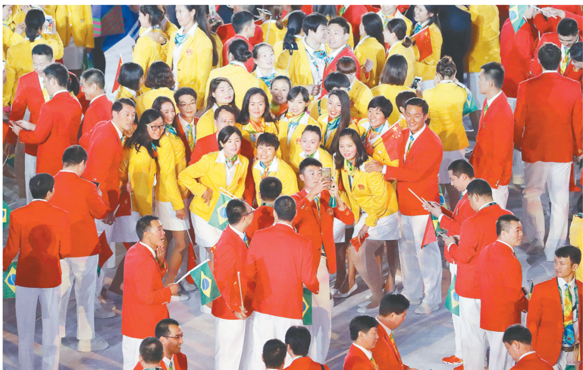
入场式上，中国代表团的小伙子和姑娘们玩儿起了自拍。