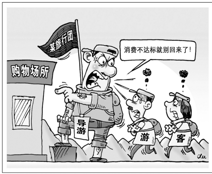
胁迫 新华社发 徐骏 作

“导游威胁我们,说一个小时不买就在店里逛两个小时,两个小时不买就逛三个小时,三个小时不买就逛一天。在店里要是不买东西就把人围起来,对着骂。”吴女士说。