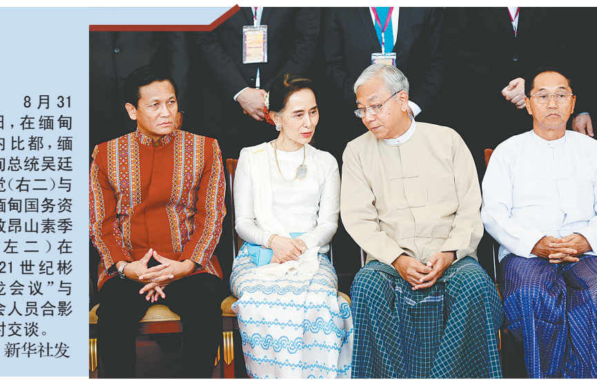
8月31日，在缅甸內比都，缅甸总统吴廷觉(右二)与缅甸国务资政昂山素季(左二)在“21世纪彬龙会议”与会代表合影时交谈。

缅甸21世纪“彬龙会议”即和平大会，8月31日起在內比都的国际会议中心举行。观察人士认为，此次会议规模空前，各方代表表达出构建和平、争取和解的意愿，这对缅甸实现稳定与发展至关重要。这也标志着深受各界瞩目的缅甸和平进程进入新阶段。