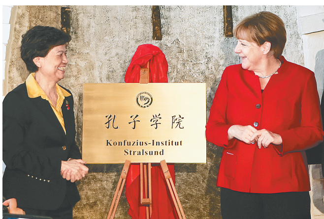
8月30日，在德国东北部滨海小城施特拉尔松德，德国总理默克尔(右)出席孔子学院的揭牌仪式。

8月30日午后，阳光明媚，秋高气爽，德国东北部滨海小城施特拉尔松德一改往日的平静。市政厅前的广场上，鼓声阵阵，彩旗翻腾。德国总理默克尔当天亲临小城，为德国第十七家孔子学院——施特拉尔松德孔子学院揭牌。