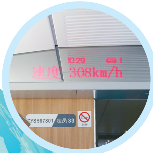
郑徐高铁试运行时速已超过300公里