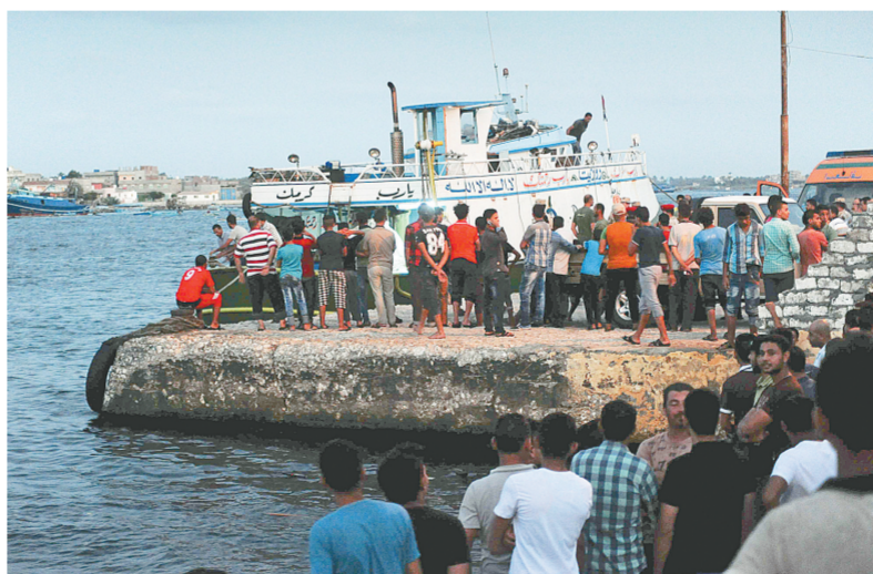
9月21日，在埃及北部地中海海岸附近，人们在沉船事故发生后聚集在岸边。新华社发