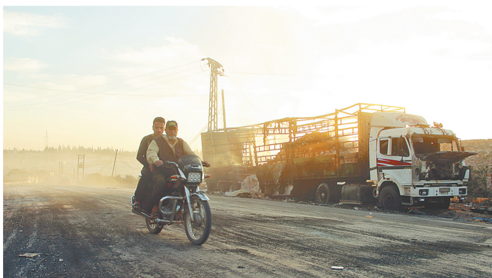
9月20日，在叙利亚北部城市阿勒颇西部叙反对派控制地区，两名男子骑摩托车经过一辆在空袭中遭摧毁的卡车。叙利亚军方19日宣布，在为期7天的停火结束后叙境内发生严重火灾事件，造成数十人死亡。

一艘载有大约600名非法移民的船只21日在埃及北部海域沉没，已造成至少43人遇难，尚有约400人下落不明。埃及地方官员说，船上难民主要来自埃及、苏丹、索马里等非洲国家，目的地可能是意大利。沉船原因很可能是超载。