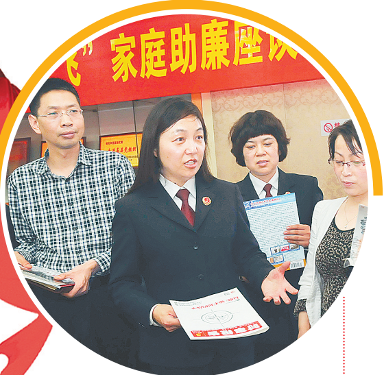
基层检察机关举行家庭助廉座谈会

(记者 成燕 李娜 王红 赵文静 侯爱敏 覃岩峰 裴蕾 袁帅 张勤 董艳梅 李爱琴 石闯 冉小平 整理)