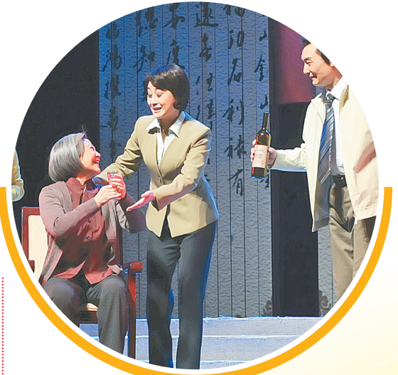
豫剧《清风茶社》让党员受到反腐倡廉教育

——用好巡察监督。深化完善市县党委巡察制度,扩大巡察覆盖面,在市县党委一届任期内完成对相应对象的巡察监督,县级党委还要延伸巡察软弱涣散的行政村(社区)党组织。建立完善市县巡察监督联动机制,推动巡察监督向基层延伸,督促被巡察党组织落实整改主体责任,制定切实可行的整改方案,做到件件有着落、事事有交代。