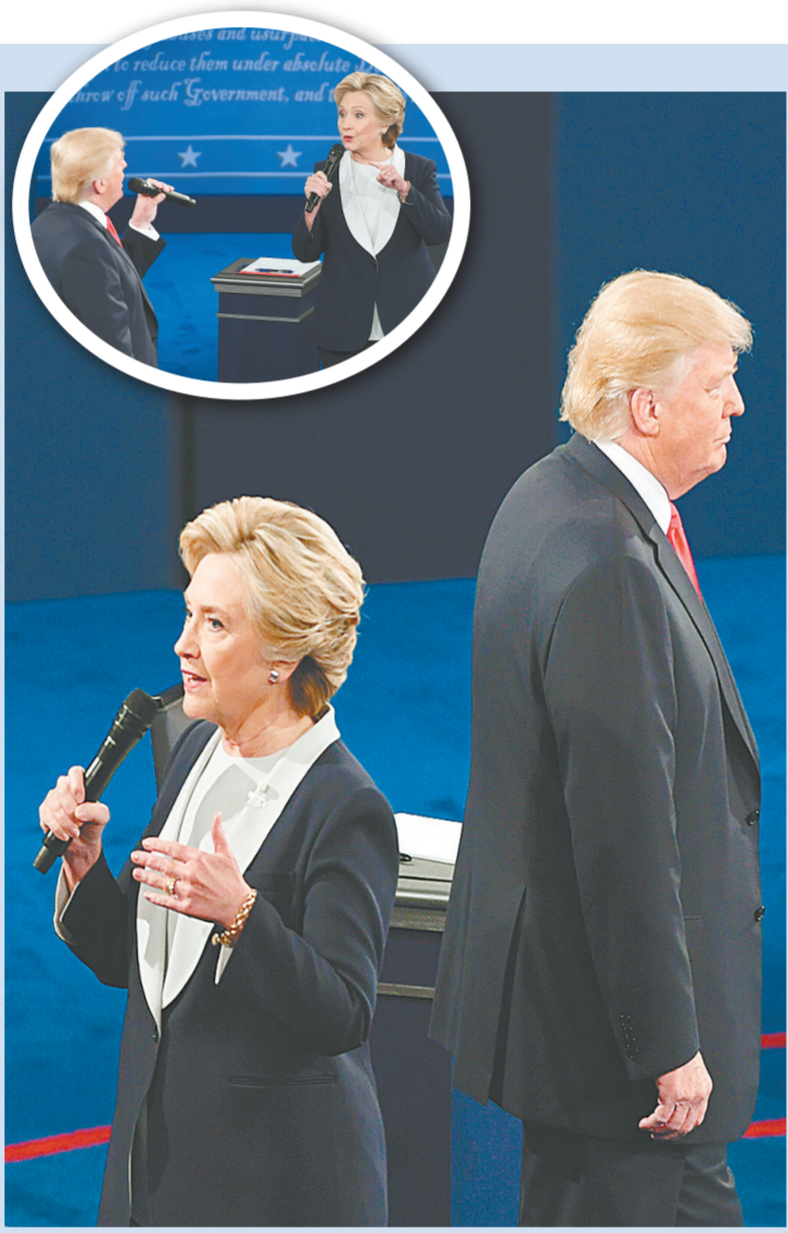
10月9日,在美国密苏里州圣路易斯的华盛顿大学,美国民主党总统候选人希拉里·克林顿在辩论会现场发言。当日,美国共和党总统候选人唐纳德·特朗普和美国民主党总统候选人希拉里·克林顿在华盛顿大学参加2016年美国总统候选人第二场电视辩论。

美联社上月报道,希拉里竞选团队手头可支配的现金当时比特朗普阵营多5500万美元。美联社计算:即使每天花费220万美元,持续到11月8日总统大选日,希拉里的团队也不必担心经费“弹尽粮绝”。新华社特稿