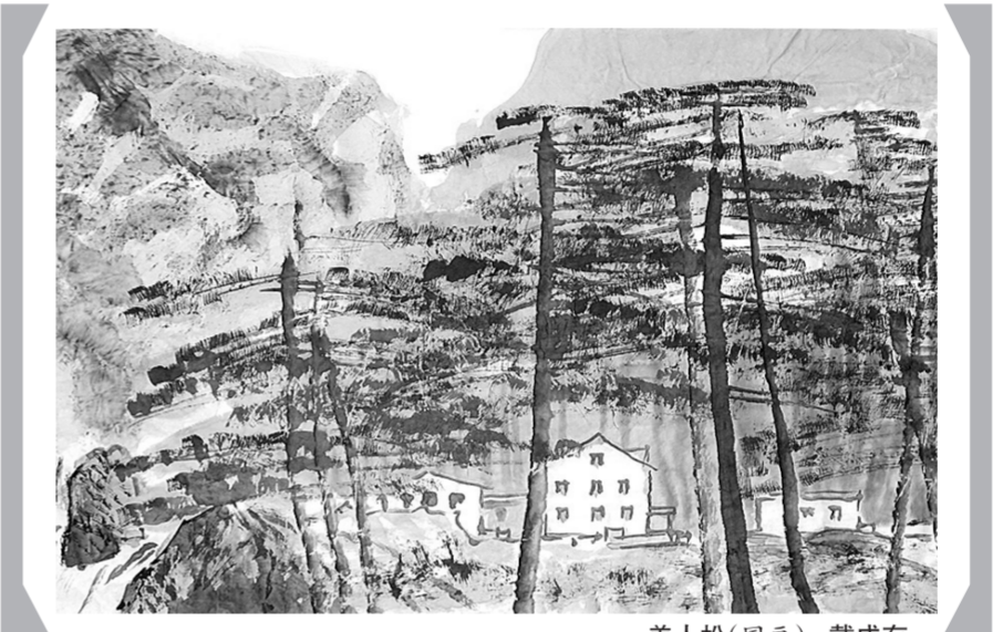
美人松(国画) 戴成有