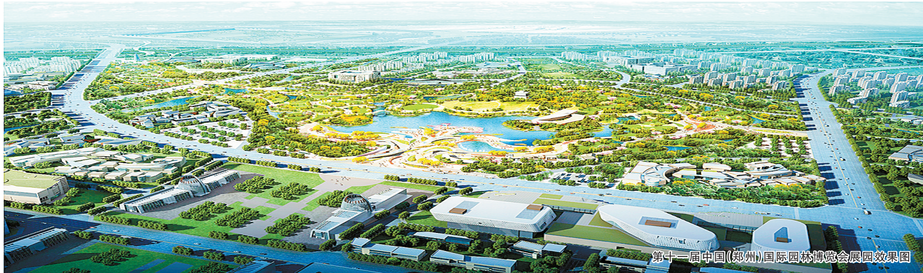
第十一届中国（郑州）国际园林博览会会展效果图