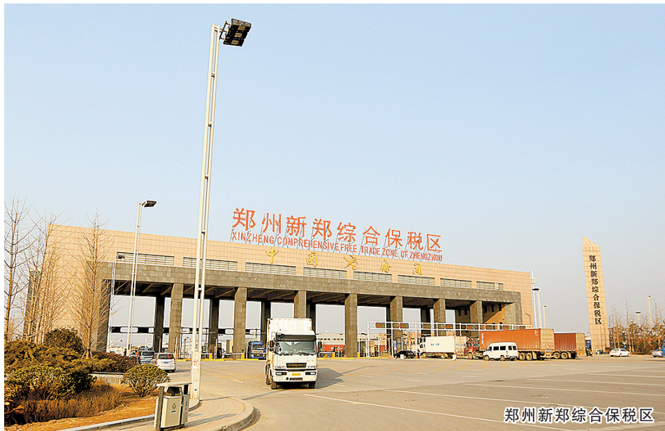
郑州新郑综合保税区

截至目前，该区已建成投用特种商品进口指定口岸有鲜花、鲜果、水产品、肉类、活牛、邮政等，在建口岸有食品、药品、医疗器械等，正在申报口岸有植物种苗、罗汉松、汽车航空口岸等。此外，已建成投用的支撑平台包括河南电子口岸、口岸作业区、跨境电商信息平台等，真正实现了“一次申报、一次检验、一次放行”，以及“区港联动”与“机、公、铁”不同运输方式的无缝衔接。