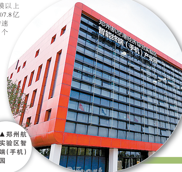
▲郑州航空港实验区智能终端（手机）产业园

12条，水域面积4.95平方公里，总长度约57.8公里。目前，已建成城市公园3个、廊道4条、水系2条，总绿化面积647万平方米，累计完成投资39亿元。园博园、双鹤湖公园、古城遗址公园等项目建设正在快速推进，2017年9月将正式对外开放。放眼未来，郑州航空港实验区绿地覆盖率将超过38%，人均公共绿地面积将超过国家园林城市要求的11平方米标准，达到人均14平方米。