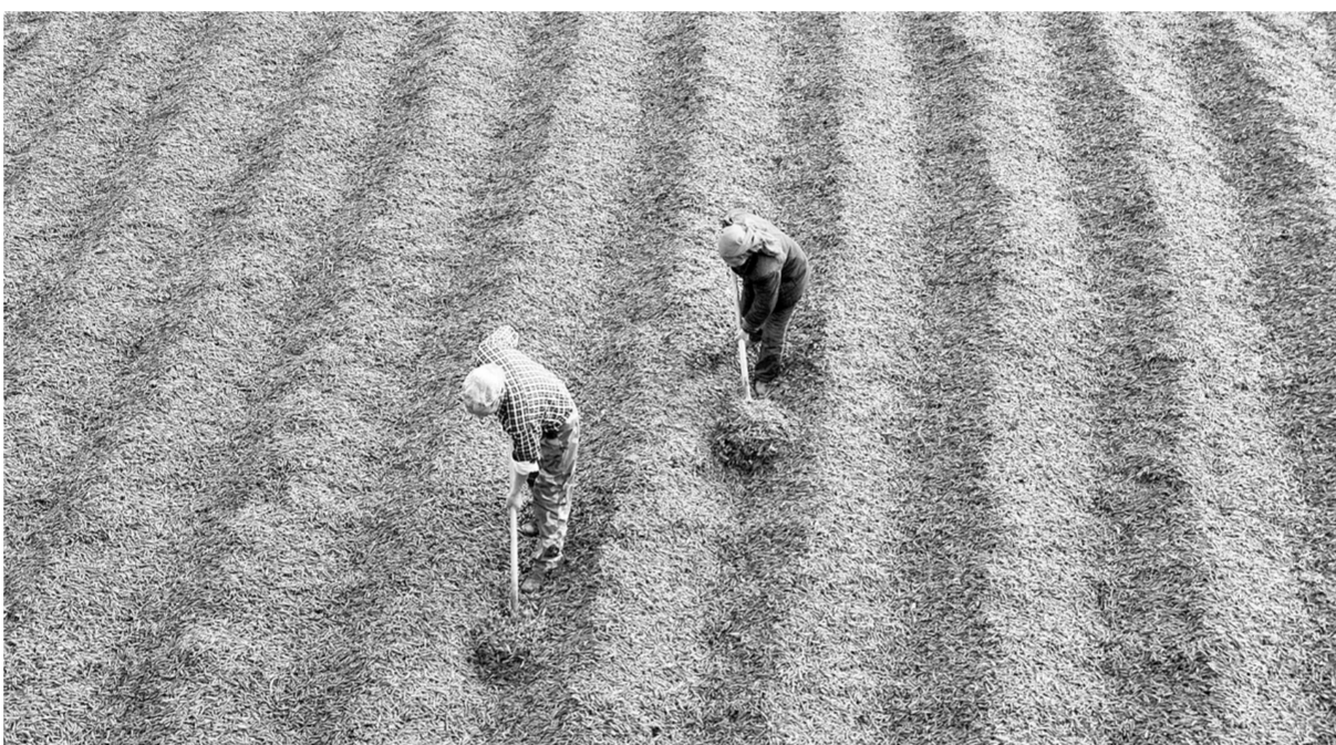
11月17日,河南省内黄县六村乡椒农在晾晒尖椒。眼下,河南省内黄县种植的30余万亩辣椒进入丰收的季节,当地农民抓住晴好天气进行摘收、销售,乡间处处是一派火红景象。