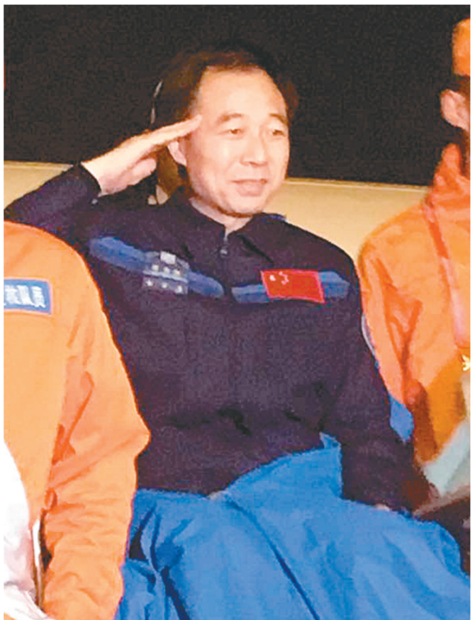
18日晚,圆满完成天宫二号与神舟十一号载人飞行任务的航天员景海鹏、陈冬乘坐专机从内蒙古平安飞抵北京。