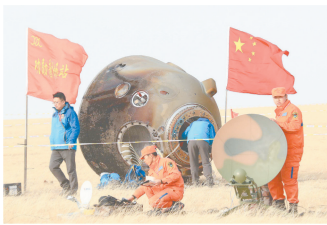
上图 飞船返回舱在内蒙古主着陆场成功着陆。下图 飞船返回舱内画面。