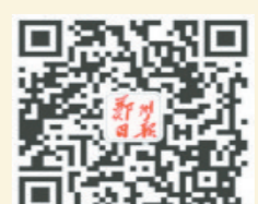
郑州日报官方微信