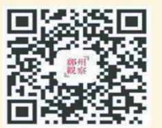
郑州观察客户端 (Android版)