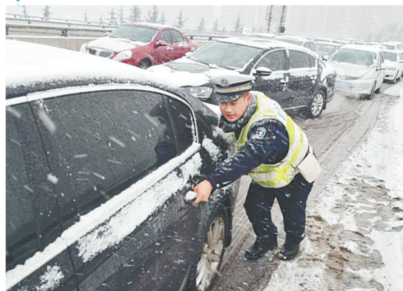
西环科学大道上桥匝道结冰,车辆打滑,交警帮忙推车。