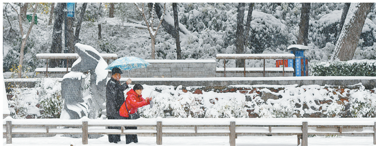
在初雪飘落的紫荆山公园,市民拍下美丽的雪景。

从冷空气21日抵达郑州开始,空气质量就明显好转,困扰绿城数日的雾霾也随之烟消云散。21日当天,全市9个空气质量监测点的空气质量显示为优或者良,当日下午3时,我市解除重污染天气黄色预警。