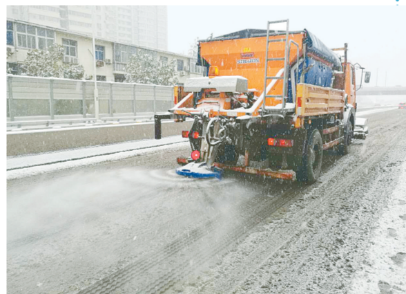
机械化除雪,保道路畅通。