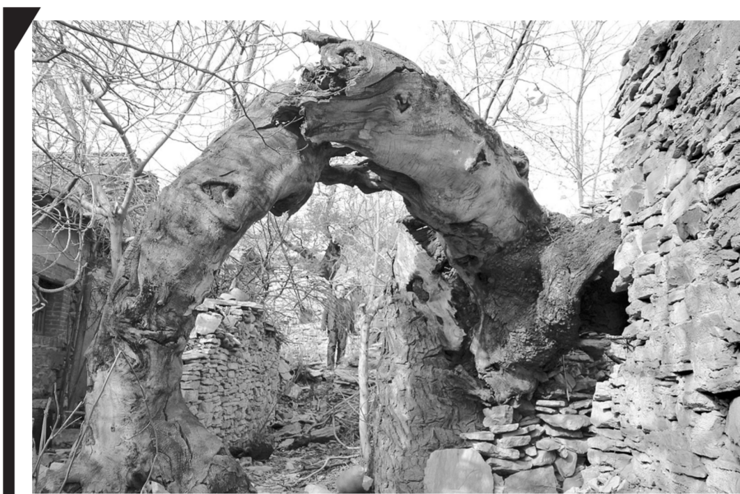
遗弃的村庄(选自《家园——梁冠山摄影集》)

原来我们听到的天籁,竟然是热烈的爱之呼唤。人们听蛙声可以宁静,其实青蛙的世界,颇不宁静。它类的热烈,在人们眼里,偏偏解作宁静。