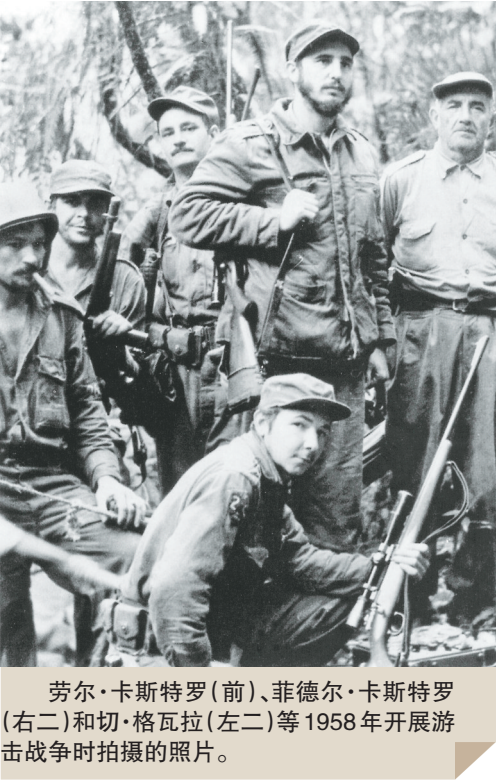
劳尔·卡斯特罗（前）、菲德尔·卡斯特罗（右二）和切·格瓦拉（左二）等1958年开展游击战争时拍摄的照片。