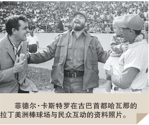
菲德尔·卡斯特罗在古巴首都哈瓦那的拉丁美洲棒球场与民众互动的资料照片。