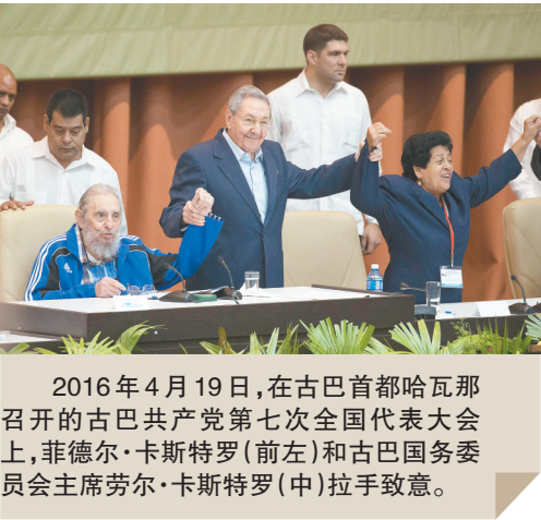
2016年4月19日，在古巴首都哈瓦那召开的古巴共产党第七次全国代表大会上，菲德尔·卡斯特罗（前左）和古巴国务委员会主席劳尔·卡斯特罗（中）拉手致意。