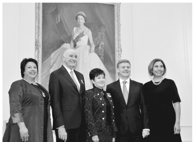
新西兰总督帕齐·雷迪(中)12日在总督府任命执政党国家党新任党首比尔·英格利希(右二)为政府总理，接任辞职的约翰·基。雷迪同时任命国家党副党首葆拉·贝内特(左一)为副总理。

1996年，欧盟出对古巴“共同立场”，将古巴改善人权和民主化等问题作为与其发展关系的先决条件。古巴政府则以“干涉内政”为由拒绝，成为拉美地区唯一没有与欧盟签署任何双边协议的国家。直至2014年4月，双方才开始“政治对话与合作协议”的双边框架协议谈判。