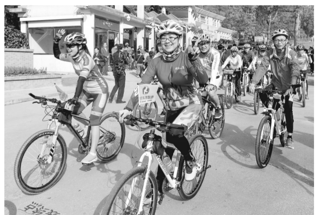
12月11日，来自北京、广东、广西、四川、河南等地的近1000辆房车、轿车、摩托车、自行车从广西凭祥友谊关口岸出发，将跨境中国、越南、老挝、泰国四国进行自驾文化交流。