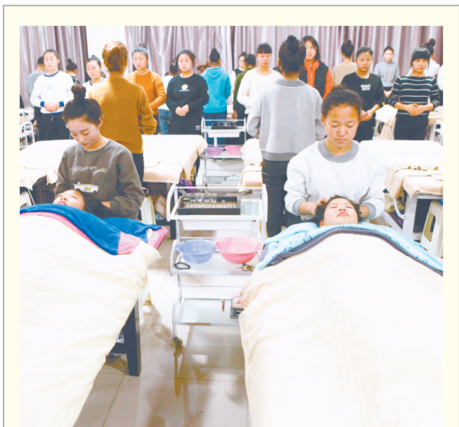
为提高农村劳动力技能水平和就业能力,近日,金水区人社局举办了免费美容护肤培训班,共有90余人参加培训。

交警部门表示,今后将会把日常治理和不定期联合多部门集中整治行动开展下去,在银基商圈创造一个好的交通环境,给市民的出行提供保障。