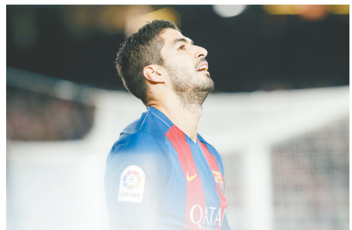
12月18日,巴塞罗那队球员苏亚雷斯在比赛中。当日,在2016/2017赛季西班牙足球甲级联赛第16轮比赛中,巴塞罗那队主场以4:1战胜西班牙人队。