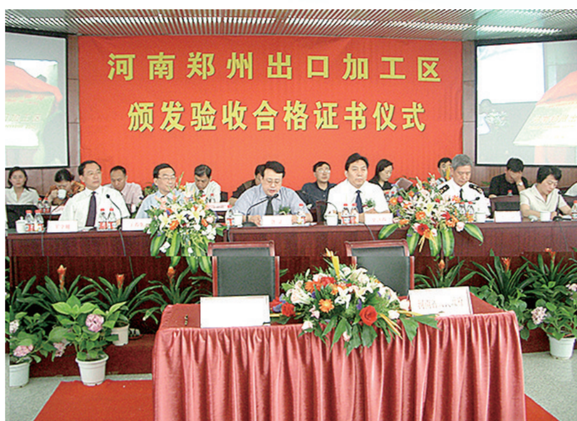
2004年6月1日河南郑州出口加工区揭牌

2006年,河南郑州出口加工区出口额为1114万美元;2008年,出口额达6219万美元;2010年,出口额达9707万美元……连续多年,出口额年均增长率达193%。选择新的生存与发展空间,满足多样化的发展需求,河南郑州出口加工区这块昔日“荒凉”正在发生巨变。