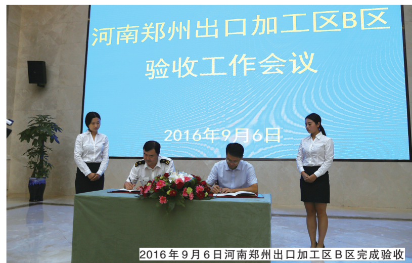
2016年9月6日河南郑州出口加工区B区完成验收

蓄力一纪,可以远矣。站在新的历史起点上,融合改革、转型新生的河南郑州出口加工区,将顺应国家“一带一路”战略,利用中国(河南)自由贸易试验区制度创新先机,依托国际陆港货运便利优势,继续开来,阔步前行,努力建成省市对外开放的新区域,更好地服务国家双创示范基地和国家中心城市!