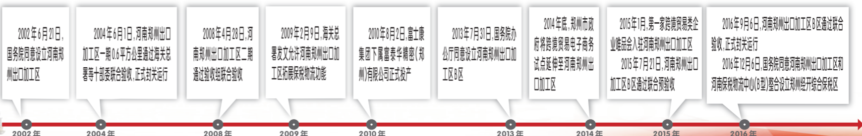
河南郑州出口加工区发展大事记