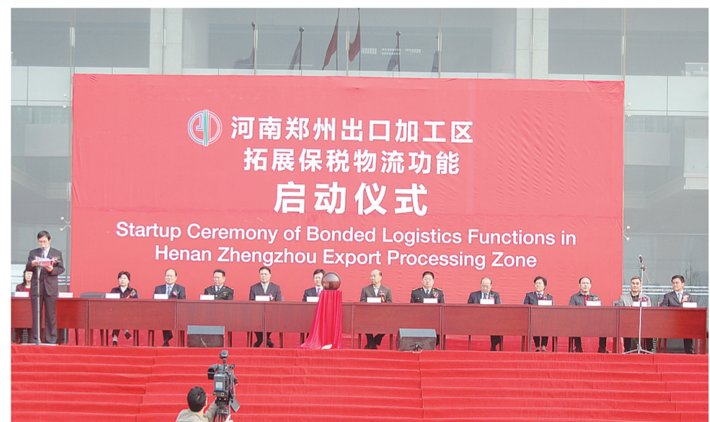
2009年2月9日河南郑州出口加工区保税物流功能启动