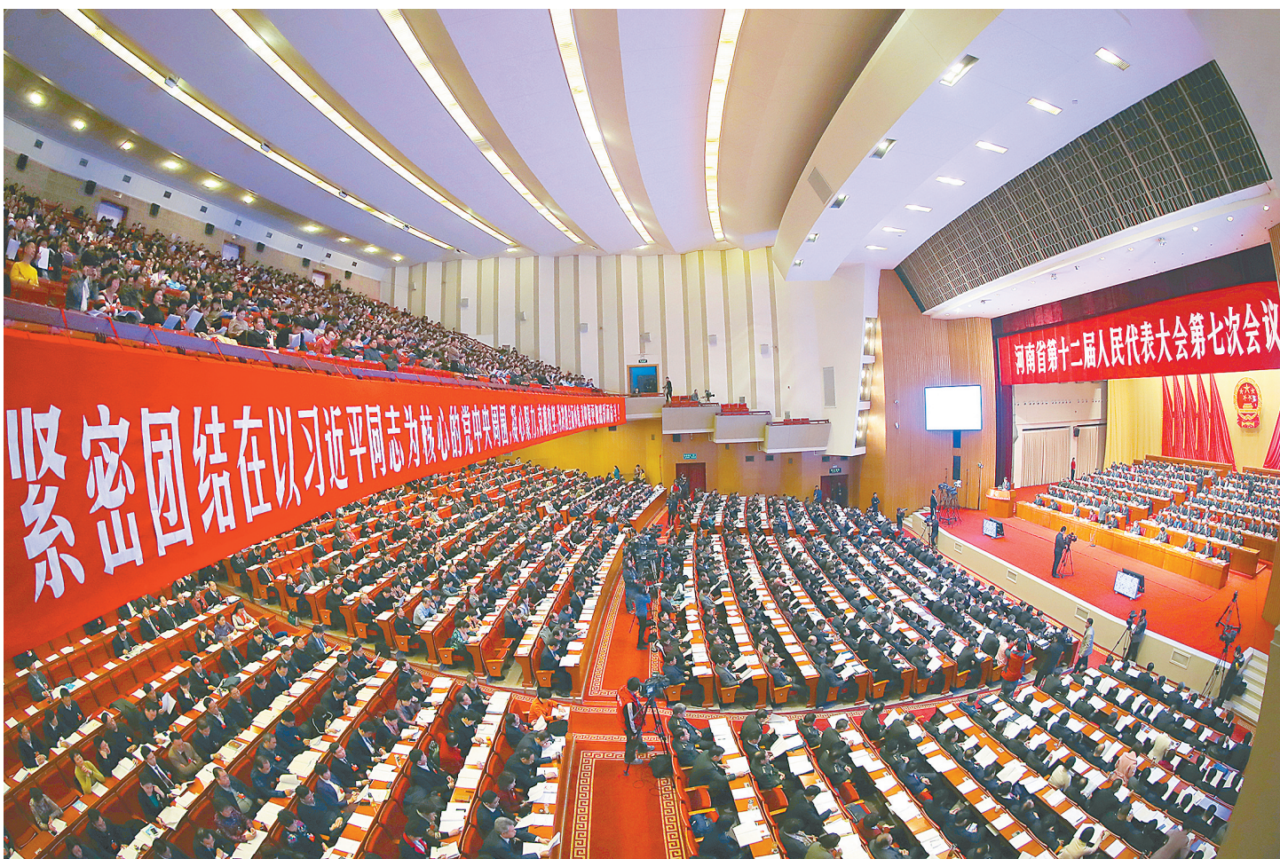
1月16日,河南省第十二届人民代表大会第七次会议在省人民会堂开幕。

陈润儿说,今年政府工作的总体要求是:全面贯彻党的十八大和十八届三中、四中、五中、六中全会精神,更加紧密地团结在以习近平总书记为核心的党中央周围,深入贯彻习近平总书记系列重要讲话和调研指导河南工作时的重要讲话精神,深入贯彻党中央治国理政新理念新思想新战略,统筹推进“五位一