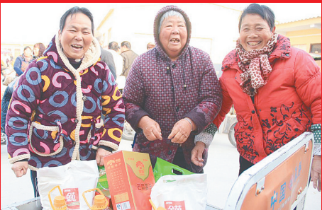
收到春节“大礼包”的村民喜出望外

这样一来,他们家就能领6份物品。“发米、面、油最实惠,去年俺家领的油够吃一年。” 据介绍,每年为群众发放过节福利,是铁三官村为村民送祝福和温暖的传统。全村2000多人,每人都有福利。米、面、油是生活必需品,很受群众欢迎,除了米、面、油,每人还发放500元的过节费用。为了体现尊老、孝老传统,60岁以上老人能多领一份物品。