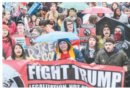
民众冒雨游行抗议。

就职演讲。他抨击华盛顿政治圈，塑造自己“圈外人”形象，指责“华盛顿兴旺了，但人民没能分享富裕”“政客发达了，但工作流失、工厂关闭”。特朗普宣称，要改变这一现状。特朗普描绘了一幅黯淡的美国图景：内地城市妇幼贫困，工厂倒闭离开，犯罪、黑帮和毒品夺走大量美国人的生命……在特朗普的就职演讲中，“保