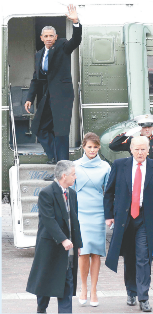
就职典礼结束后，特朗普夫妇送奥巴马离开。