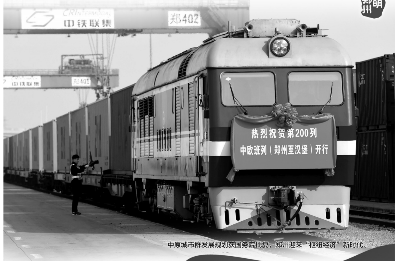
中原城市群发展规划获国务院批复,郑州迎来“枢纽经济”新时代。