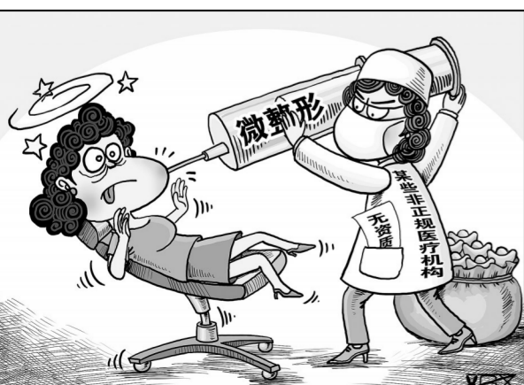
“危整形” 新华社发 翟桂溪 作

新华社北京1月24日电(记者 杨进欣)微整形是近年来医疗美容行业最热门的话题,这一高科技医疗技术因其不需开刀,短时间能获得除皱美白丰唇等效果,令很多爱美者怦然心动。中国医学科学院八大处整形医院的主治医师表示,放假后咨询微整形的人增多,但微整形并不都像宣传的那样无损伤且完全没有危险。