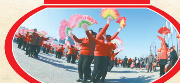
社区代表队表演广场舞

本报讯(记者 梁月琳 通讯员 宋炜炜 郑朝阳 文/图)昨日，惠济区“闹元宵民间文化艺术节”活动达到高潮。 “老鸦陈街道第十一届民间文化艺术节”活动在天河路拉开帷幕，各行政村派出40多支表演队伍，秧歌、盘鼓、曲艺、说唱、舞龙、舞狮、广场舞等轮番上演。古荥镇“元宵节民间文艺汇演”活动使得古荥东西大街变成了欢乐的海洋，10个行政村的70余支文艺队表演了舞龙舞狮、盘鼓秧歌、戏曲、旱船等民间文艺节目。长兴路街道“2017年民间艺术展演”活动在裕华广场启动。村(社区)群众文化队伍表演了盘鼓、秧歌、舞龙、健身操等。在刘寨街道同乐社区文化广场，“闹元宵，猜谜语”活动热闹非凡，18支社区代表队表演了广场舞、秧歌、歌伴舞、相声、小品等节目。惠济区图书馆还开展了“闹元宵，猜灯谜”活动。400条谜语涵盖了科普知识、生活常识、文学常识等多个方面。