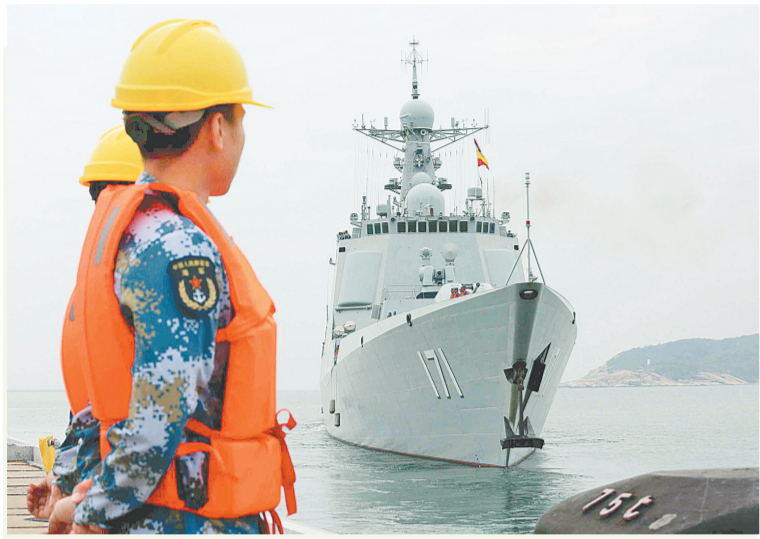
中国海军南海舰队远海训练正在进行

美国《海军时报》周刊本周早些时候以三名不愿公开姓名的五角大楼官员为消息源报道，美国海军和美太平洋司令部意图升级所谓“航行自由”行动，派更多军舰到中国在南海岛礁附近海域巡航。