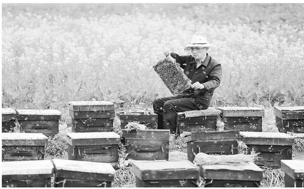
2月20日，安徽省黄山市万安镇蜂农在油菜花田里放蜂制蜜。