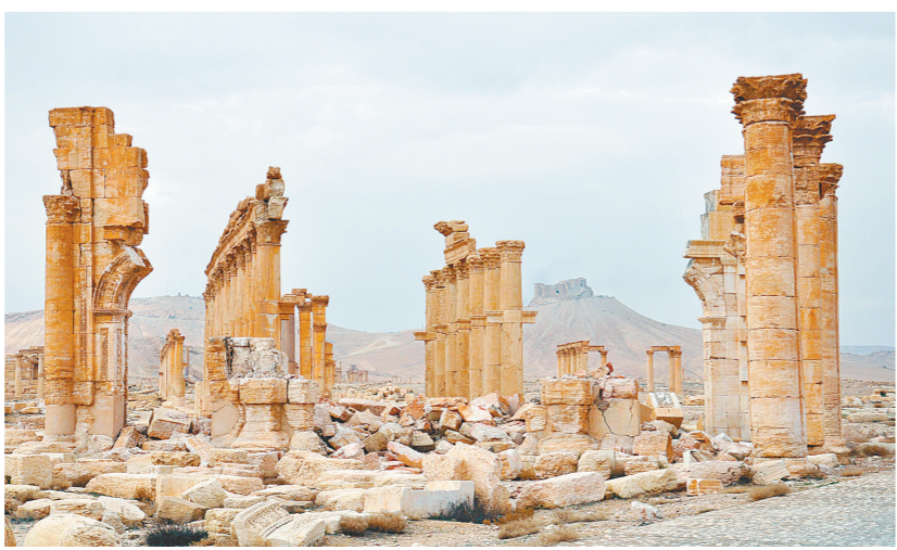
这是3月3日拍摄的叙利亚中部古城巴尔米拉。叙利亚军方2日宣布，政府军当天成功收复叙中部古城巴尔米拉。

分析人士指出，中断达10个月之久的叙问题日内瓦和谈2月23日重启以来，进行得并不顺利，双方一度连怎么谈、谈什么这些程序和形式上的问题都达成共识。能够确定谈下去，而且在最后时刻为下一轮和谈定下议程，应该说是一个积极进展。用德米斯图拉的话说，这为下一轮和谈“奠定了一个良好的基础”。