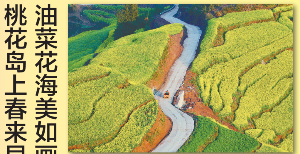
这是3月4日在云南省罗平县拍摄的油菜花田。春回大地，云南省罗平县大面积油菜花开放，空中望去，层层叠叠、高低起伏的花海映入眼帘。