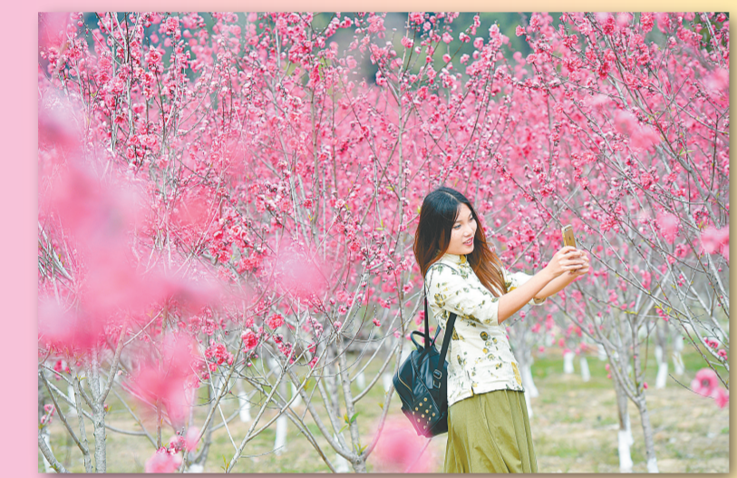
3月4日，游客在盛开的桃花间拍照。近日，福建省德化县南埕镇桃花岛桃花景区万株桃花盛开，吸引游人前来游览。