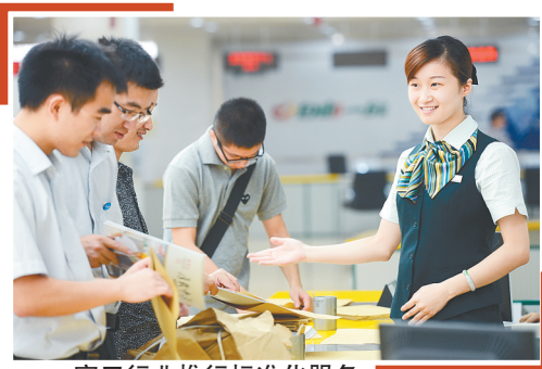
窗口行业推行标准化服务

用改革的办法深入推进“三去一降一补”。要在巩固成果基础上,针对新情况新问题,完善政策措施,努力取得更大成效。