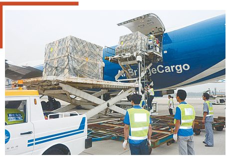
航空经济风生水起

面对国际环境新变化和国内发展新要求,进一步完善对外开放战略布局,加快构建开放型经济新体制,推动更深层次更高层次的对外开放。