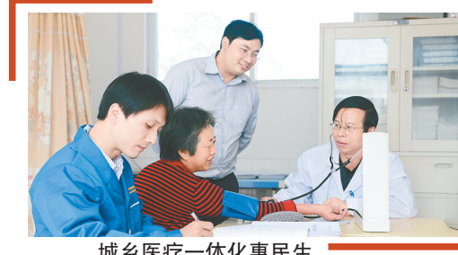
城乡医疗一体化惠民生

推进以保障和改善民生为重点的社会建设。民生是为政之要,必须时刻放在心上、扛在肩上。在当前国内外形势严峻复杂的情况下,更要优先保障和改善民生,该办能办的实事要竭力办好,基本民生的底线要坚决兜牢。