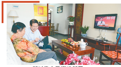
新时代农民搬进新居

深入推进农业供给侧结构性改革,完善强农惠农政策,拓展农民就业增收渠道,保障国家粮食安全,推动农业现代化与新型城镇化互促共进,加快培育农业农村发展新动能。