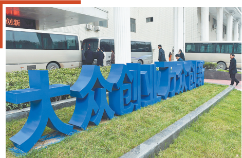
“双创”拓展就业新空间

以创新引领实体经济转型升级。要深入实施创新驱动发展战略。推动实体经济优化结构,不断提高质量、效益和竞争力。