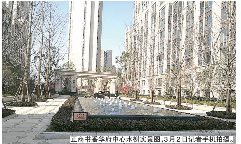
正商书香华府中心水榭实景图,3月2日记者手机拍摄。

我们常说,交房是郑州开发企业面临的一道大考,安置房和公租房检验开发企业的社会责任。在书香华府,配建了一栋可容362户家庭入住的公租房,无论是从外部立面,还是户型的全面通透设计、经济实用的功能、精简明快的装修,包括不可移动的卫浴用品、花洒、橱柜等一应俱全,完全实现拎包入住。以商品房的品质、精装修的标准建设公租房,这是正商勇担社会责任、高品质建设的最好明证。