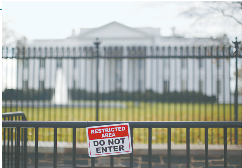
白宫外的“禁止进入”标示牌。

记者还了解到,为确保大射电望远镜在工作中不受干扰,大射电望远镜5公里核心区为“静默区”,屏蔽所有移动信号。游客进入大射电望远镜台前,凭景区门票在游客服务中心扫码寄存个人手机、数码相机、智能手环等一切电子产品。目前,景区内已设置多个有线电话亭,游客可免费拨打国内电话。为减少人流密集对望远镜的干扰,每天景区接待游客限量2000人。