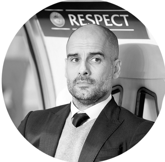
瓜迪奥拉在场边观战

“我来曼城是为了夺得欧冠冠军?呃,我争取了。我还会继续努力。”瓜迪奥拉说。他表示,曼城如果都像下半时这样比赛,足以夺取欧冠奖杯。