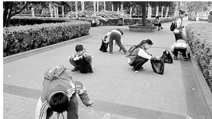
3月15日,优胜路小学的学生在老师和家长志愿者带领下来到人民公园,开展“爱园护绿”活动,他们将园内的垃圾纸屑捡起,还提醒游客在踏青游玩时自觉维护环境。

这样的场景昨日遍及金水全区。大清扫活动采取包干打扫、分头行动的方式,集中对辖区道路及楼院内的暴露垃圾、乱堆乱放、卫生死角、楼道卫生、蜘蛛网以及小广告等进行整治。据统计,昨日金水区共出动2000余人,自卸车、板车、三轮车、铲车等60余辆机动车辆。共清理生活垃圾1300立方米、建筑垃圾650立方米、混合垃圾450立方米,清理杂物乱堆乱放480余处,清扫卫生死角520余处,清除墙体小广告950余处。