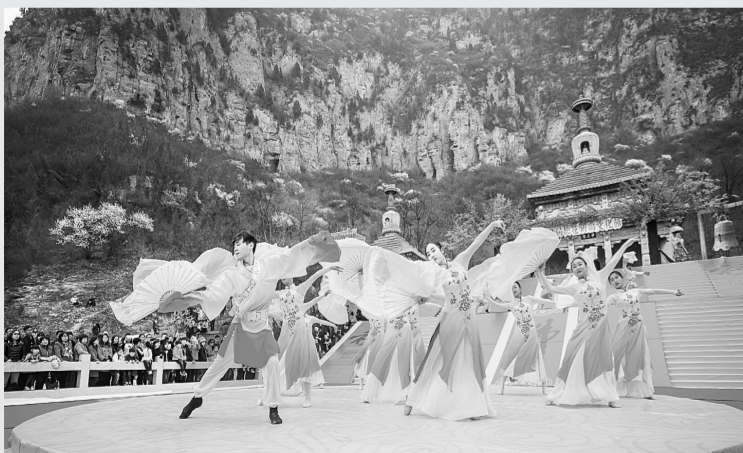
桃花祈福文化节开幕式上的文艺展演

由于不了解麝鼠的生活习性,民警迅速联系河南省救护中心,于当天上午将麝鼠送交野生动物救护中心继续观察。