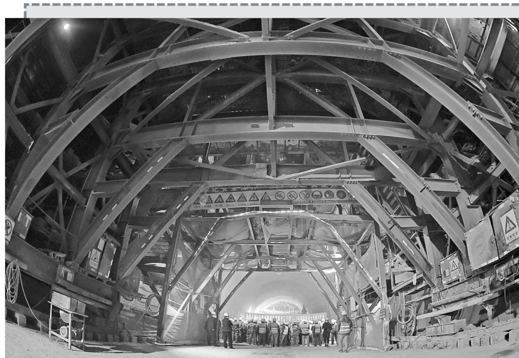
3月20日,施工建设者在朝阳隧道内庆祝隧道贯通。当日,位于辽宁省朝阳市境内的京沈高铁朝阳隧道贯通。该隧道由中铁四局集团京沈高铁项目部施工建设,全长6750米。至此,京沈高铁辽宁段39座隧道全部贯通。

作为急需人才的大省,本次河南招聘团的胃口着实不小,本次招聘活动有205家单位参加,共招聘8259人,其中事业单位3847人,博士后科研流动站、科研工作站、研发基地758人,中央驻豫企业、省属国有企业、大型民营企业1530人,机关504人,郑州、洛阳、新乡市岗位1620个。并且,本次河南揽才的目标直接锁定清华、北大、人大等京城名校的博士、硕士人才。活动现场,我省还将集中向毕业生展示河南经济社会发展情况,人才发展环境和引进优秀人才、高校毕业生就业创业的优惠政策。