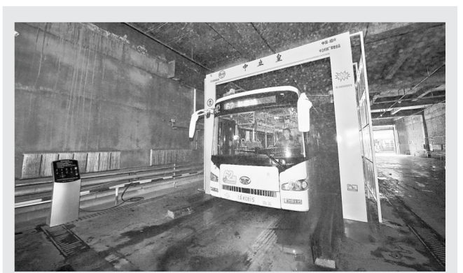
3月20日,长春公交集团巴士公司一车队司机驾驶车辆通过洗车机。近日,长春公交集团的大型公交车洗车机在巴士公司一车队投入使用。这款洗车机需司机和操作人员两人同时工作,可将以往人工操作2小时左右的洗车时间压缩至3分钟。新华社记者 张楠摄

国际市场方面,美国能源信息署(EIA)近日公布的数据显示,截至3月10日当周,美国原油库存减少23.7万桶,美国原油库存意外下降,该消息利好国际油价。观望后市,市场对石油减产延期仍存疑虑,信心不足,加之美元维持强势地位,预计短期油价将继续维持震荡态势。