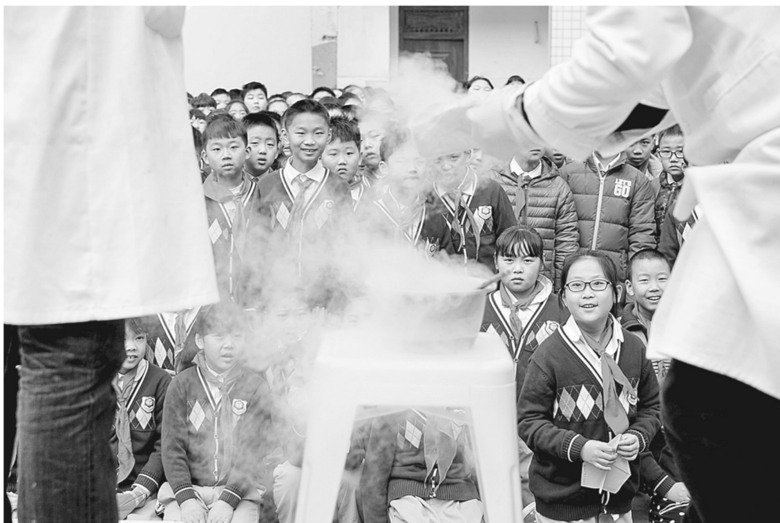
昨日,纬一路小学科学实验秀吸引了孩子们的目光。当日,该校历时一个半月的创客文化节正式开幕。

《通知》强调,任何组织、机构、个人不得以任何形式平调、挤占、挪用、骗取补助资金,各级民政、财政部门要高度重视,积极协调配合,切实做好提标增发工作,确保及时足额发放到位。