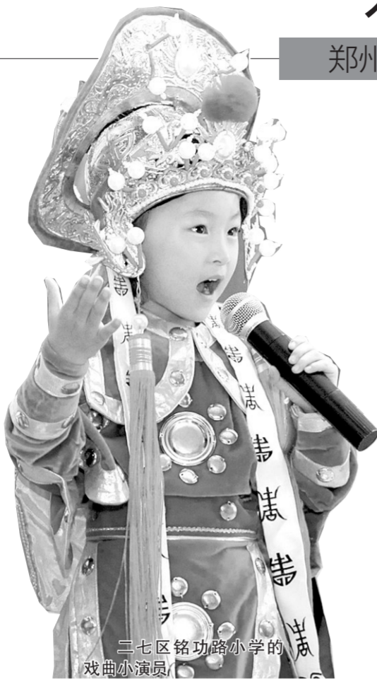
二七区铭功路小学的戏曲小演员

戏曲是中华传统文化的瑰宝,“戏曲进校园”更是对文化传承的担当。去年底,市教育局出台“戏曲进校园”活动通知,今年2月,又进行了“戏曲进校园”活动配套教材开发研讨。我市不少学校已经根据自身特点,循序渐进地开展了各具特色的“戏曲进校园”活动,培育孩子戏曲素养,重拾戏曲艺术精神,传承戏曲文化精粹。