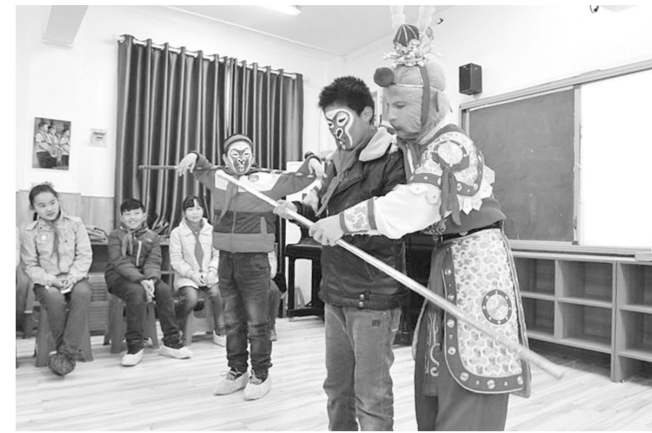
金水区文化路小学二小邀请河南豫剧青年团优秀演员走进课堂,对学生戏曲表演进行指导。

戏曲是中华传统文化的瑰宝,“戏曲进校园”更是对文化传承的担当。去年底,市教育局出台“戏曲进校园”活动通知,今年2月,又进行了“戏曲进校园”活动配套教材开发研讨。我市不少学校已经根据自身特点,循序渐进地开展了各具特色的“戏曲进校园”活动,培育孩子戏曲素养,重拾戏曲艺术精神,传承戏曲文化精粹。