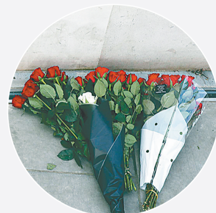
3月23日,在英国伦敦,鲜花摆放在警察局外,悼念恐袭遇难者。