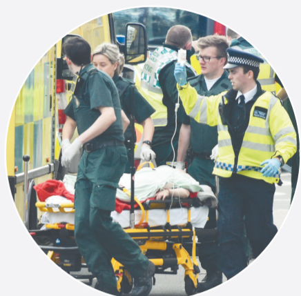
3月22日,在英国伦敦的议会大厦外,救援人员将伤者运送至救护车上。

使馆网站显示,目前使馆已与受伤中国公民及其家属取得联系,并积极提供领事协助。新华社特稿