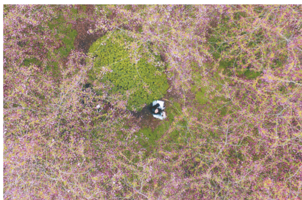
郑州大学的海棠花

正值百花争艳、万木吐绿的季节,桃花、海棠、樱花……各种各样的花儿欢快地盛开。21日~23日,记者跑遍城市各个方向,数十次的无人机起降,为你呈现一组别样的春天美景。