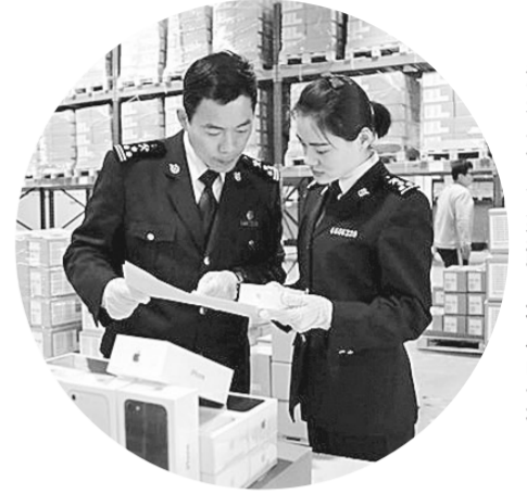
海关工作人员查验出境成品手机