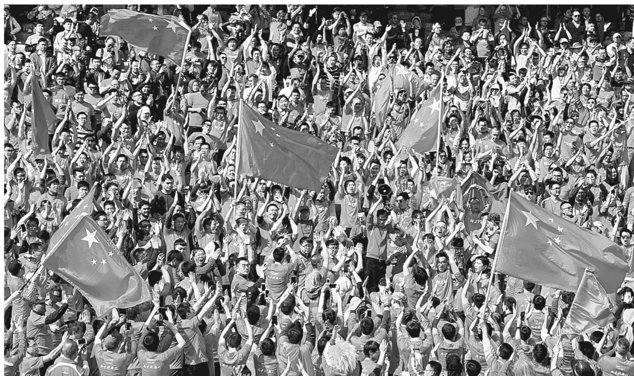
右上图:在德黑兰,中国球迷仍然提供了最大的支持。

在稍晚一些进行的同组另外一场比赛中,乌兹别克斯坦队主场1:0击败卡塔尔队,以12分继续占据小组第三的位置。在只剩下三轮比赛的情况下,目前仅积5分的中国队想要追上乌兹别克斯坦队,难度极大。