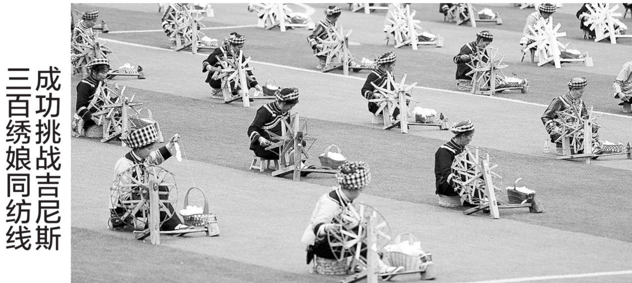
3月29日,在贵州省望谟县民族中学内,来自望谟县的331名布依族绣娘同时用纺线车纺线,成功挑战吉尼斯世界纪录。此次挑战选手年龄最大的88岁,最小的40岁。

3月25日13时55分许,内蒙古包头市土默特右旗沟门镇北只图村向阳小区5号居民楼2单元发生爆炸事故,造成5人死亡,25人受伤。