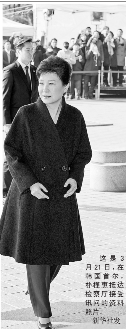
这是3月21日，在韩国首尔，朴槿惠抵达检方接受审问的资料照片。

检方此前说，鉴于此案“共犯”朴槿惠亲信崔顺实、前青瓦台幕僚长金淇春以及涉案行贿人三星电子掌门人李在镕等均已被逮捕，从公平角度讲，检方应该针对朴槿惠申请逮捕令。新华社特稿