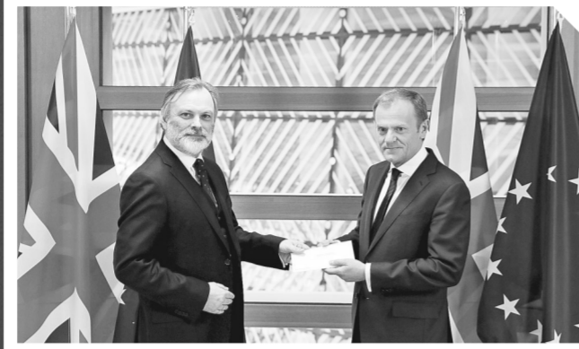
3月29日，在比利时布鲁塞尔，英国驻欧盟大使蒂姆·巴罗（左）将“脱欧”函递交给欧洲理事会主席图斯克。

新华社北京3月29日电 英国首相特雷莎·梅29日正式向欧盟递交“脱欧”信函，这意味着在加入欧盟44年后，英国成为首个寻求退出该联盟的成员国。