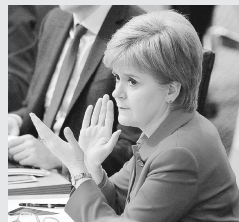
3月28日，在英国爱丁堡，苏格兰政府首席大臣、执政党苏格兰民族党领袖斯特金参加苏格兰议会辩论。

在2014年9月举行的苏格兰独立公投中，约55%的选民不支持苏格兰独立。在去年英国“脱欧”公投中，苏格兰大部分选民选择留在欧盟。